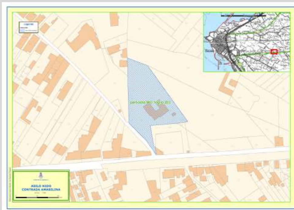
Figura 1 – Planimetria Catastale

L'area di intervento è identificata nel Piano Peep del Comune di Marsala come attrezzatura di interesse collettivo.